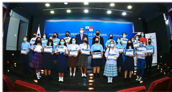
Ceremonia de entrega de reconocimientos – Diciembre 2021

De manera simbólica, el Ifarhu realizó la entrega de reconocimiento a 20 estudiantes de noveno grado de colegios oficiales y particulares de todo el país que ocuparon los primeros puestos de sus colegios. En total 4,900 estudiantes recibieron becas de puesto distinguido, con el propósito de que continúen sus estudios de nivel media y superior.