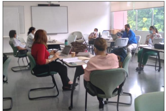
Reunión de Trabajo en la USMA

Las principales áreas de demanda de formación de recursos humanos que el país requiere identificadas, corresponden a: