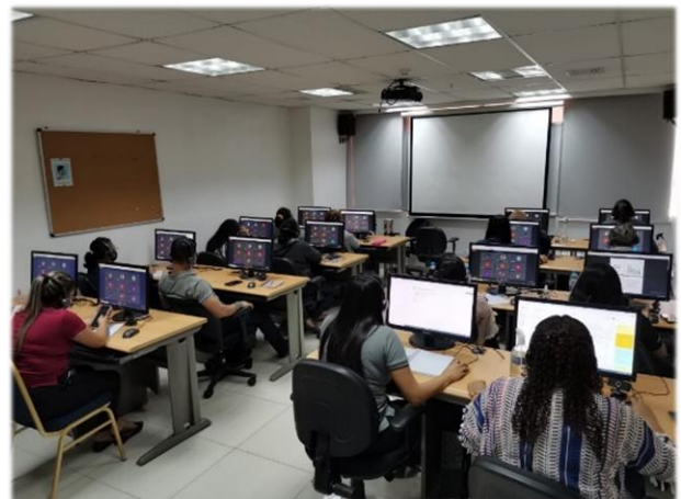
Aula Virtual de Capacitación - Curso de Excel

Para ampliar los conocimientos y elevar los niveles de desenvolvimiento y destrezas de los funcionarios, se llevaron a cabo una serie de capacitaciones en diversos temas.