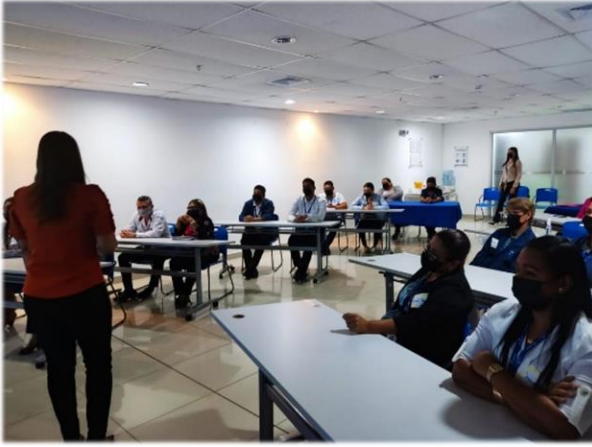
Salón de Capacitación – Atención al Cliente