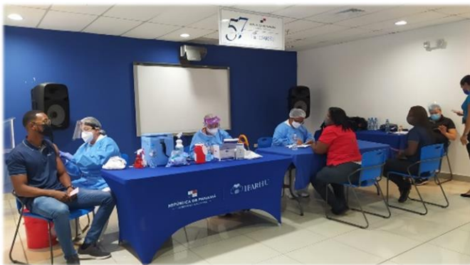
Vacunación contra la Covid-19

Con el objetivo de garantizar una vida sana y promover el bienestar para todos los colaboradores de la Institución se llevaron a cabo ferias de salud y jornadas de vacunación contra la Covid-19.