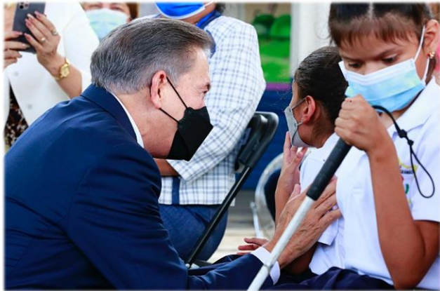
El Presidente Laurentino Cortizo Cohen, junto a una beneficiaria del subprograma de Asistencia Económica a Estudiantes con Discapacidad – Abril de 2022