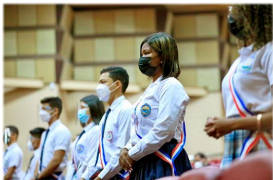
Beneficiarios del concurso “Transformando Vidas”- Enero 2022

Por primera vez se realizó el concurso “Transformando Vidas” que benefició a cuarenta y dos estudiantes que ocuparon los primeros puestos en sus colegios oficiales y particulares a nivel nacional, de la promoción 2021. Estos fueron seleccionados y beneficiados con una beca internacional al participar de este concurso, para realizar estudios superiores en países como Canadá, Costa Rica, Cuba, Brasil, España y Estados Unidos, en carreras relacionadas al área de Ciencias Químicas, Ingeniería Eléctrica, Ciencias Biológicas, Economía, Ingeniería de la Ciencia e Informática, entre otras.