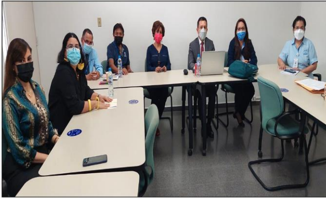
Reunión de trabajo para la elaboración del informe final de resultados

Entre algunas de las necesidades identificadas en estas áreas, están: Inteligencia Artificial, Planificación de Fincas Ganaderas, Especialista en Investigación Social, Administración de Cadena de Suministro, Tecnología de Vehículos Eléctricos, Asesores Turísticos, Calidad y Mejora de la Educación, entre otras.