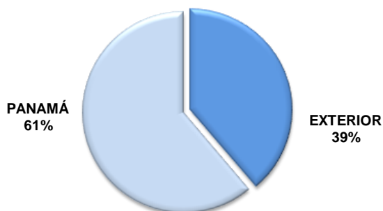
DISTRIBUCIÓN DEL CRÉDITO EDUCATIVO, SEGÚN LUGAR DE ESTUDIO: ENERO A OCTUBRE 2018

(P) Cifras preliminares