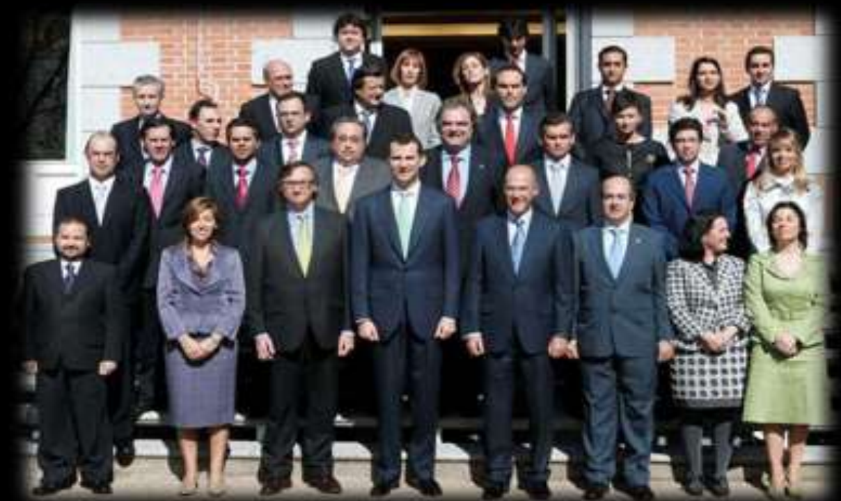
Reconocimiento del Rey de España a ITAE